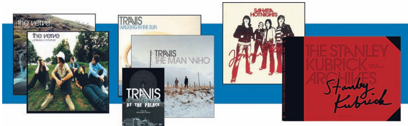
Clássica e moderna: quase 40 anos depois, a Avant Garde continua em uso