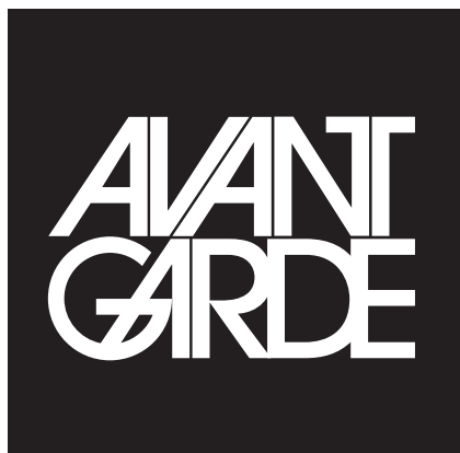
Ao criar o logotipo da nova publicação, Lubalin não imaginava que estava criando uma nova fonte tipográfica

Com seu conteúdo adulto, textos com linguagem direta e nudez explícita, caiu nas graças de publicitários, diagramadores e diretores de arte. Estes profissionais